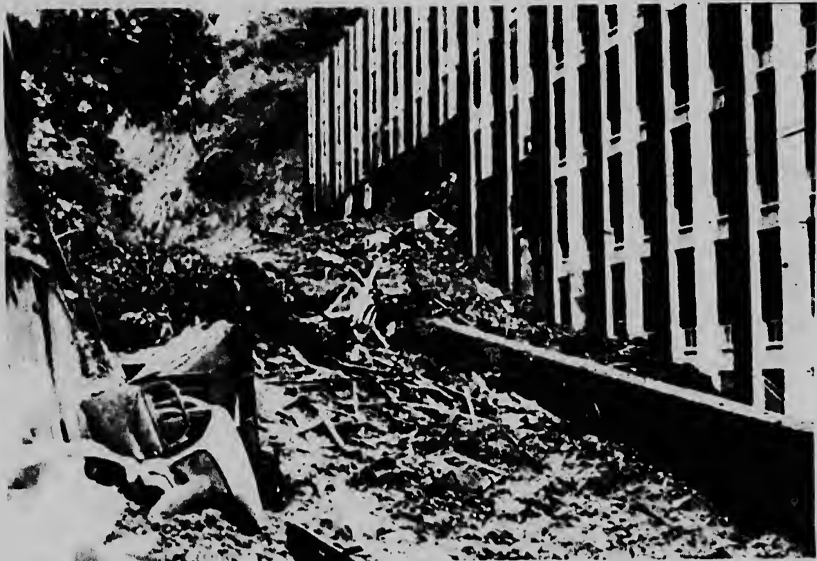
RIO DE JANEIRO--Un avalancha di terra casi ta tapa un truck cerca di e edificio di apartamento aki. Esaki ta resultado di e tres dianan consecutivo di awacuru cu tabatin na Rio. Cientos di persona a muri den e desastre aki, y miles a keda sin cas.

pa diesdos miembro -- cuater pa cada continente -- lo tin e tarea di concreto, e movimiento liberador contra e paisnan "imperialista, colonialista y neocolonialistanan". Cuba, segun a ser informa, no solamente lo ta sede central di e organismo, sino qu su secretario general lo ta un Cuba tambe.